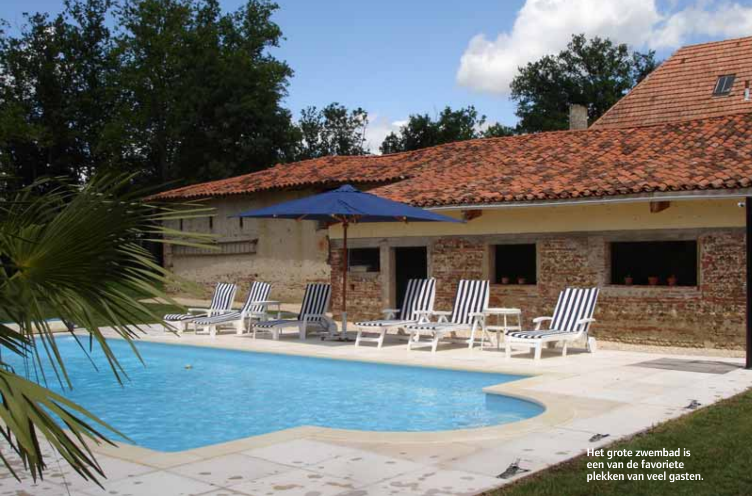
Het grote zwembad is een van de favoriete plekken van veel gasten.