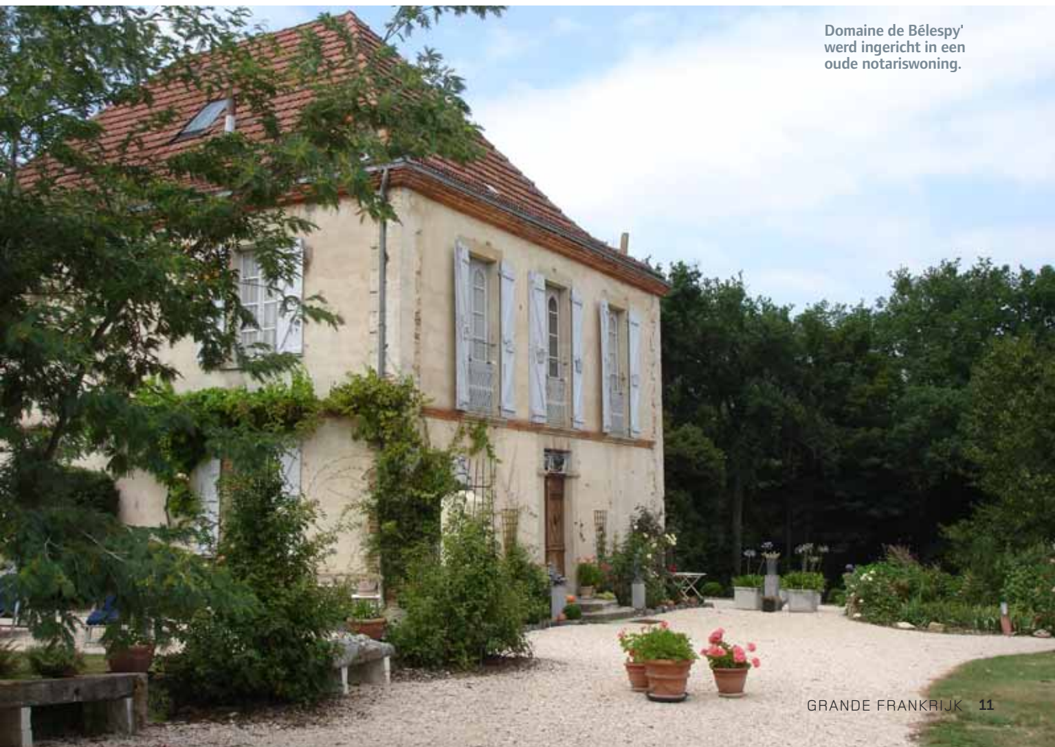
Domaine de Bélespy' werd ingericht in een oude notariswoning.